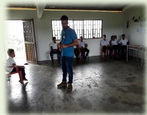
Ilustración 1 Visita en la comunidad de San

Hoy en día la educación propia nos abre las puertas para continuar fortaleciendo estos aspectos que desde las actividades desarrolladas en la chagra arrojan elementos de análisis para entender los aspectos relacionados con las formas de vida de las comunidades, este sistema educativo ofrece técnicas y prácticas útiles para la implementación de un